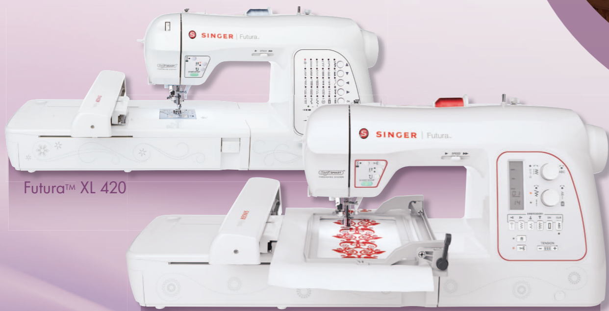
Futura™ XL 420